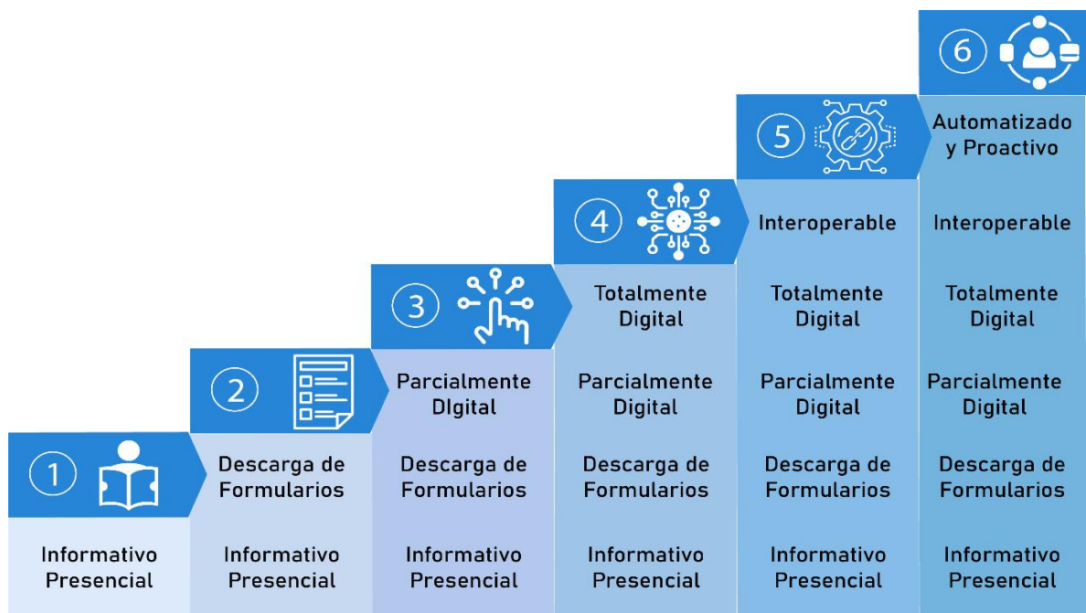
Imagen No. 2 Niveles de Transformación Digital de trámites, OPAs y consulta de acceso a información pública.

Niveles de Transformación Digital de Trámites, OPA's y consulta de acceso a información pública: